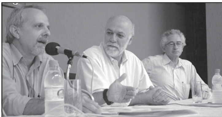
O novo Diretor, o Reitor da UFSCar e o Pró-Reitor de Graduação (da esquerda para a direita)